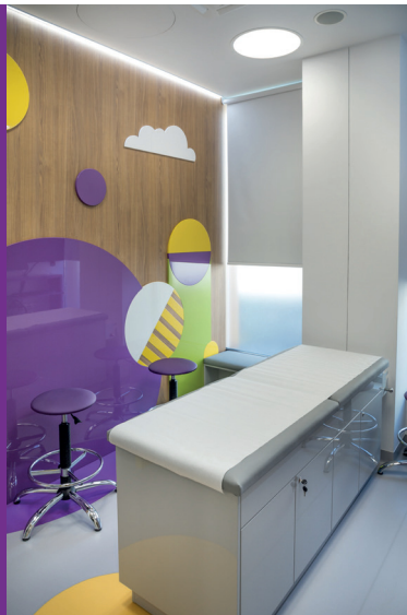
Paley European Institute - Gabinet lekarski