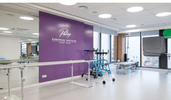
Paley European Institute

Celem konsultacji z fizjoterapeutą jest dopasowanie zaopatrzenia ortotycznego stosowanego po operacji oraz omówienie planu fizjoterapii (dni oraz godziny). Warto dopytać fizjoterapeutę o niezbędny podczas leczenia sprzęt (będzie on zapewniony przez PEI).