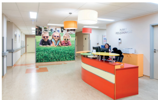
Szpital Medicover - Punkt pielęgniarski

Po zabiegu operacyjnym anestezjolog decyduje o bezpiecznym przewiezieniu Pacjenta na oddział. Początkowo Pacjent przebywa w sali intensywnego nadzoru medycznego. Jest to sala znajdująca się najbliżej punktu pielęgniarskiego, w którym jest stale monitorowany. W tej sali rodzic może przebywać z dzieckiem przez całą dobę, jednak zakazane jest tutaj spożywanie posiłków czy spanie przy łóżku dziecka. Mimo iż w tej sali dostępne są rozkładane fotele, z uwagi na jej specyfikę, obowiązuje bezwzględny zakaz rozkładania leżanek. Utrudniają one personelowi medycznemu, który stale czuwa nad bezpieczeństwem Pacjenta, dostęp do jego łóżka i podłączonej aparatury. W tej sali dziecko może wyłącznie pić, a dbanie o higienę osobistą jest możliwe wyłącznie za pomocą nawilżanych chusteczek.