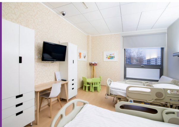
Szpital Medcover - Pokój i łazienka pacjenta