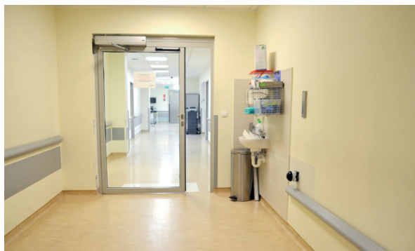
Szpital Medicover - Śluz

Premedykacja, czyli farmakologiczne przygotowanie do operacji, ma na celu uspokojenie Pacjenta przed zabiegiem. Wpływa ona na poprawę samopoczucia, niwelowanie napięcia nerwowego oraz bólu, a także na ułatwienie znieczulenia oraz zmniejszenie ilości potrzebnych leków przeciwbólowych. Odbywa się to ok. 30-40 minut przed planowaną godziną zabiegu. Podanie leku zależy od indywidualnych decyzji anestezjologa. Wywołuje ono u dziecka poczucie odprężenia oraz częściową bądź całościową utratę świadomości. W szczególnych sytuacjach lekarz może zdecydować o odstąpieniu od podania premedykacji. W tym stanie dziecko jest transportowane na blok operacyjny. Rodzic może towarzyszyć dziecku w tym momencie. Na miejscu rodzic podejmuje decyzję, czy chce iść dalej z dzieckiem. Jeśli zdecyduje się na wejście na salę operacyjną, będzie poproszony o przebranie w specjalnie przygotowane ubrania ochronne.