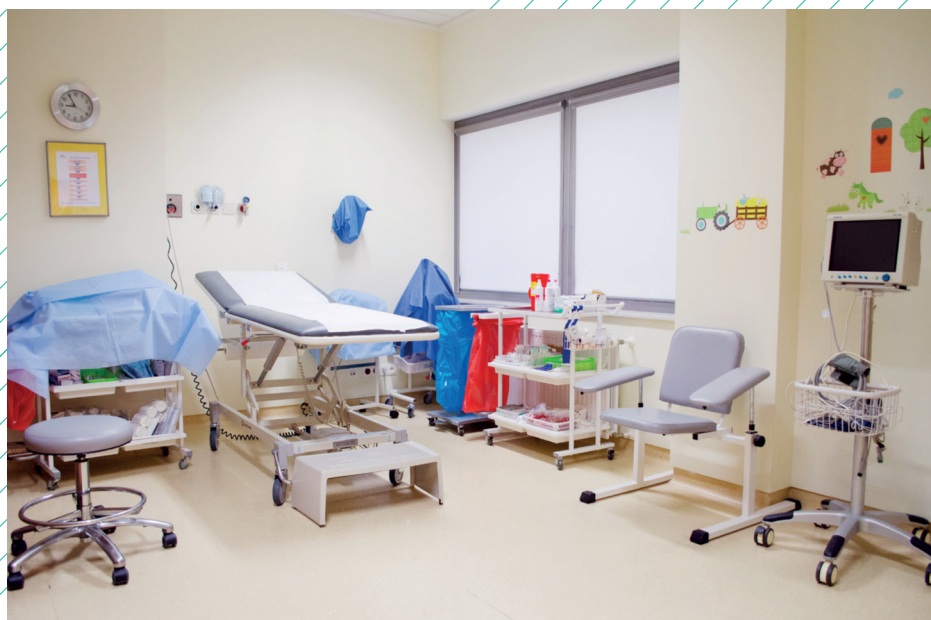
Szpital Medcover - Gabinet zabiegowy