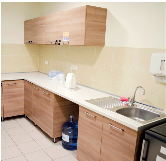
Szpital Medicover - Kuchnia oddziałowa

Dodatkowo szpital zaopatruje Pacjentów w pieluchy, podkłady oraz nawilżane chusteczki, a także pościel.